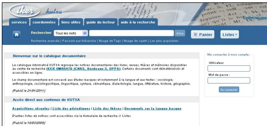
Figure 1 : accueil du site web

Les pages web de l'UMR IKER 4 et du Service commun de documentation de l'université Michel de Montaigne – Bordeaux 3 5 référencent le catalogue Kutxa. Après la connexion au site l'écran suivant devrait apparaître.