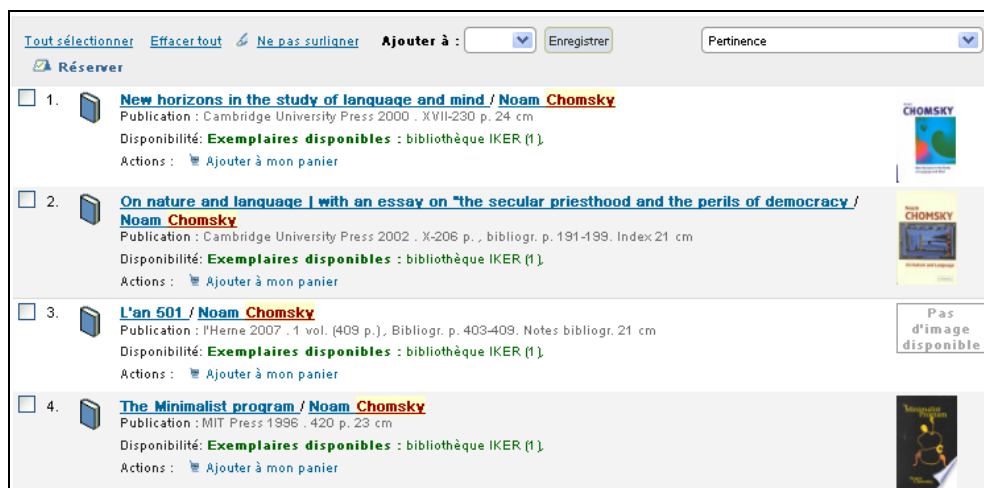
Figure 3 : résultats Au=Chomsky

auteur=chomsky : http://iker-koha.univ-pau.fr/cgi-bin/koha/opac-search.pl?idx=au&q=chomsky euskara + revue : http://iker-koha.univ-pau.fr/cgi-bin/koha/opac-detail.pl?biblionumber=981